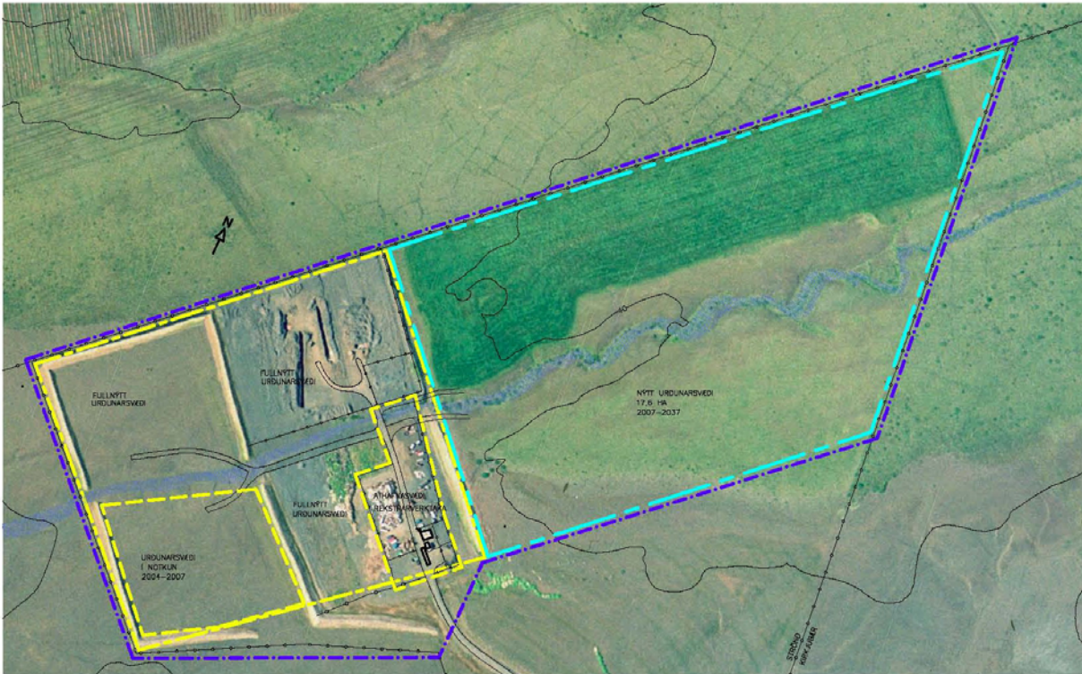
TILLAGA AD BREYTTU DEILISKIPULAGI 1:2000 (A1)