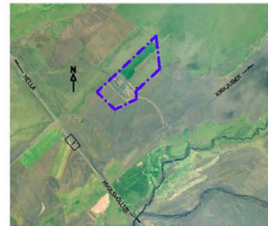
SKIPULAGSSVEÐI 1:20000 (A1)